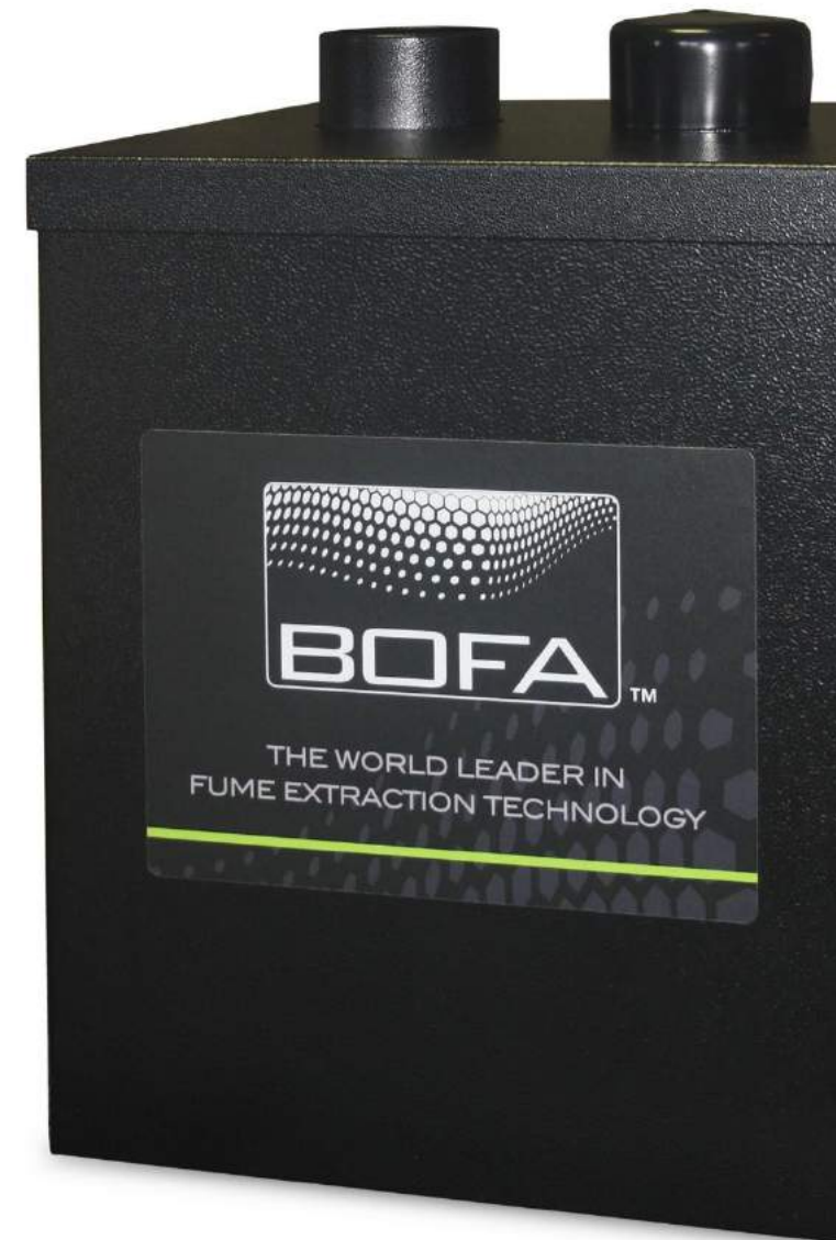
V350E Дымоуловитель для паяльных работ