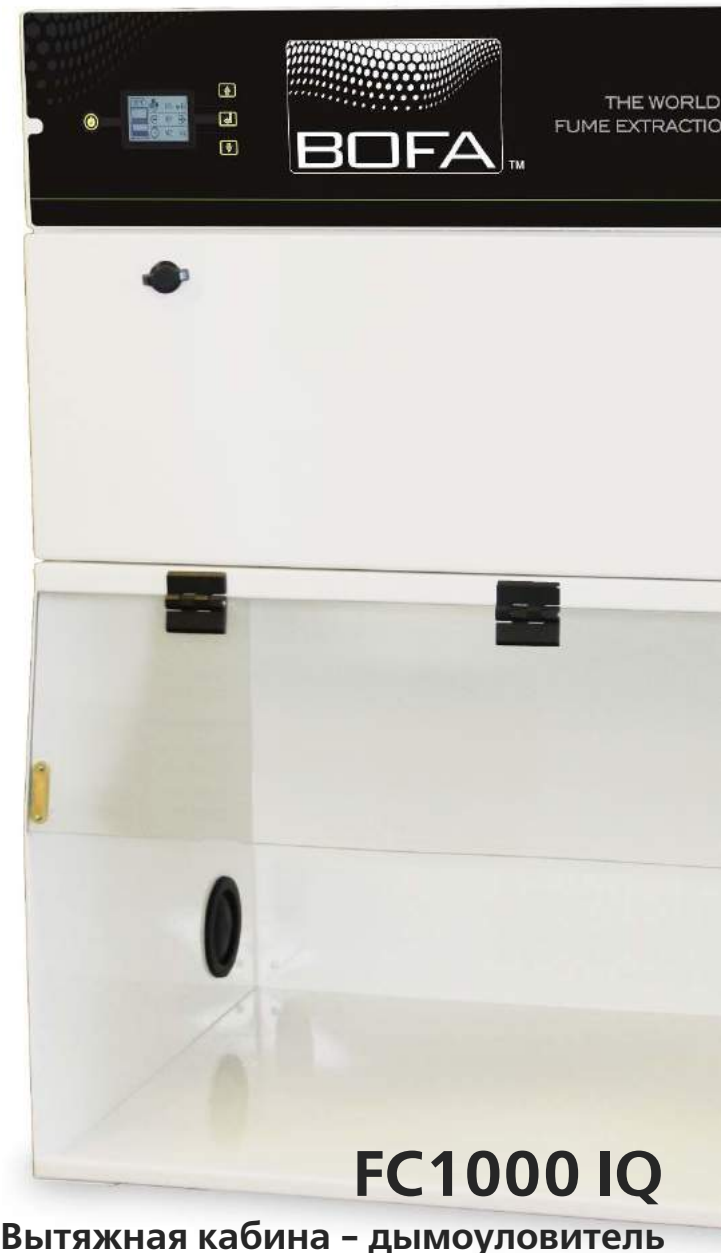
FC1000 IQ Вытяжная кабина - дымоуловитель